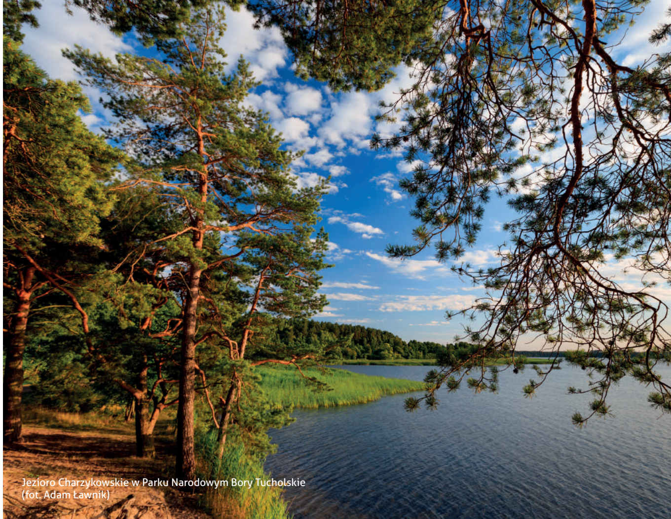
Jezioro Charzykowskie w Parku Narodowym Bory Tucholskie

Istnieje również szerokie porozumienie, że mamy etyczny obowiązek utrzymania pełnego zakresu różnorodności życia na planecie - innymi słowy, nie przyspieszać tempa wymierania ponad to, co można by było oczekiwać w naturalnych okolicznościach. Obecnie rażąco zawodzimy w tym celu, ze zdegradowanymi ekosystemami i znikającymi gatunkami, często zanim zostały one nawet rozpoznane i opisane przez naukowców.