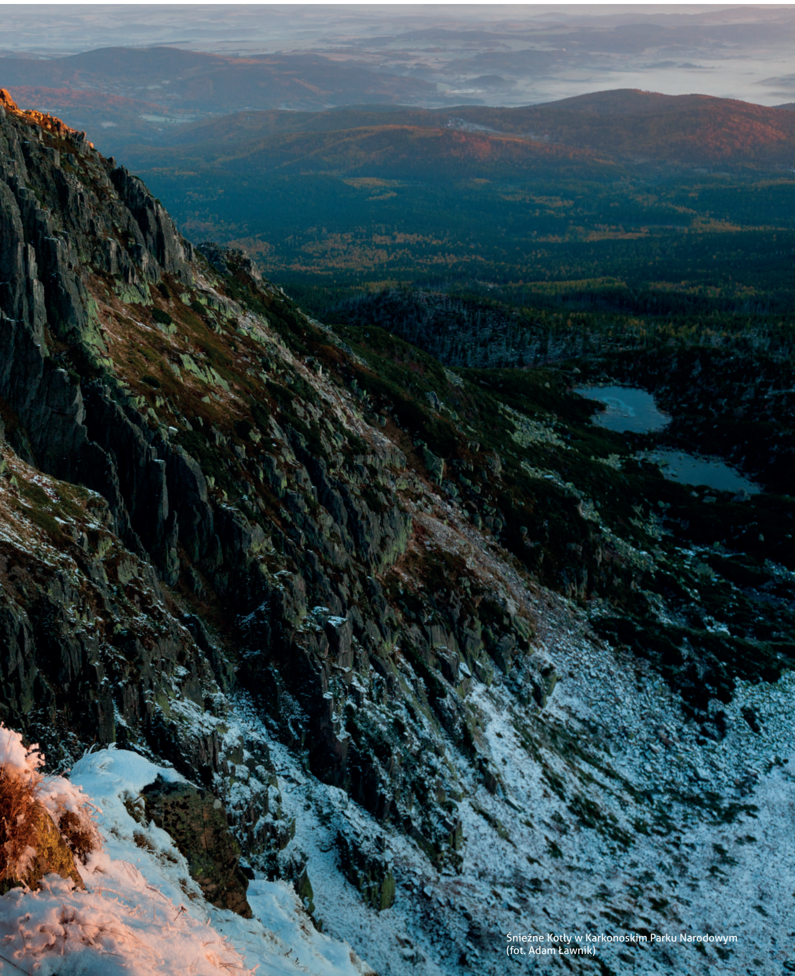
Śnieżne Kotty w Karkonoskim Parku Narodowym