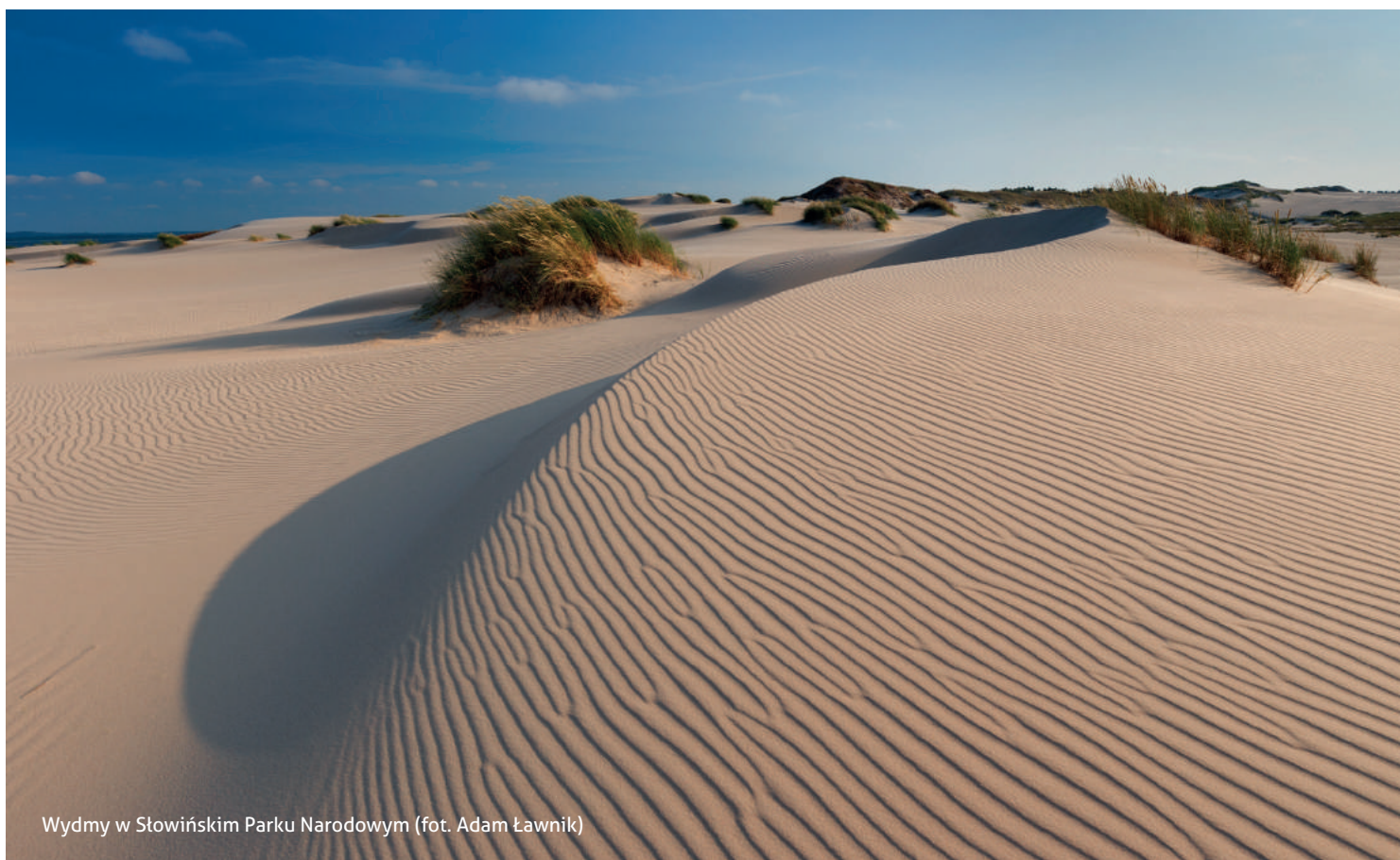
Wydmę w Stowińskim Parku Narodowym

A. Usprawnienie współpracy pomiędzy administracją obszarów chronionych (w szczególności parków narodowych) z lokalnymi społecznościami i jednostkami samorządu. Zagadnienie to, w Polsce do tej pory zaniechane, jest jedną z podstawowych przyczyn braku wsparcia dla funk-