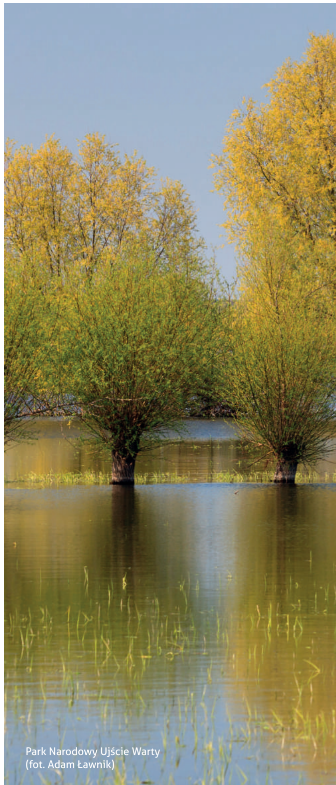
Park Narodowy Ujście Warty

Celem tych działań jest nie tylko zabezpieczenie cennych obszarów przyrodniczych, ale również stworzenie warunków do ich odbudowy i zrównoważonego wykorzystania . Dlatego też, dla realizacji tych rekomendacji, zaleca się utworzenie dedykowanych zespołów eksperckich oraz prowadzenie szerokich konsultacji z interesariuszami na różnych etapach planowania i implementacji.